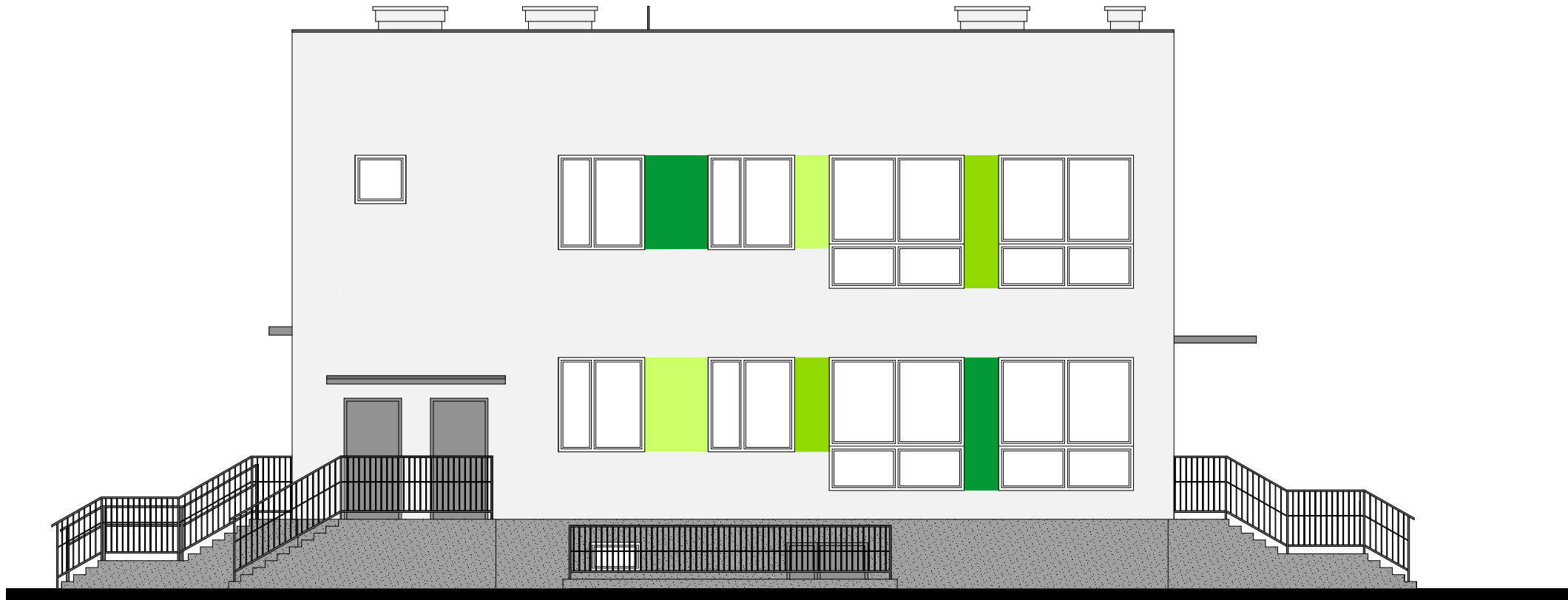
Elewacja południowa 1:100