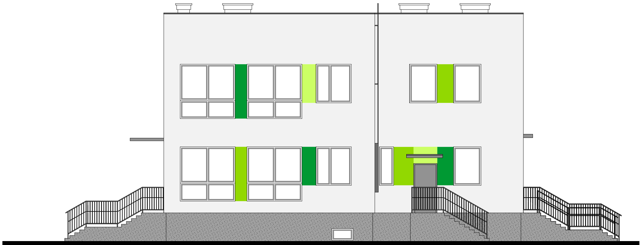
Elewacja północna 1:100